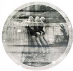
Sara Koniarek 11°

Eine Sehnsucht nach Vergangenheit entsteht bei Sara Koniareks analogen Fotografien. Sie arrangiert drei Synchronschwimmerinnen in einem leerstehenden Pool. Ihre nostalgischen Aufnahmen vom verlassenen Ort prägen die Sehnsucht nach Vergangenheit. Die Art, wie sie analoge Fototechnik und Bildsprache vereint, lässt keine zeitgenössische Arbeit vermuten.