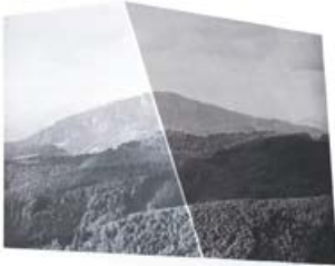
Lisa Hopf Verortung

Ausstellungsdauer: 4. – 26. September 2018