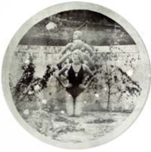
Sara Koniarek 11°

Sara Koniarek inszenierte Szenen mit Synchronschwimmerinnen in einem leeren, mit Pflanzen überwachsenen Pool. Der nostalgische Charakter der Fotoserie verrät nichts über die Entstehungszeit der Fotografien. Die Fotografin verschränkt Zeitebenen, sodass sich Hinweise auf Vergangenes mit auf die Gegenwart verweisenden Zeichen verbinden. Erinnerungen an alte Bilder verschmelzen mit eigenen Erlebnissen und laden zu einer Auseinandersetzung mit der Vergangenheit, einer Zeitreise, ein. Sara Koniarek lässt surreale Szenerien entstehen, die durch das historische Druckverfahren des Bromöldrucks zusätzlich unterstrichen werden.