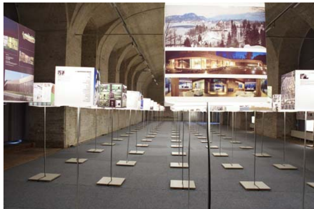
Wonderland Vienna 2006, 99 European Teams