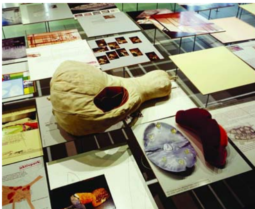
Wonderland Vienna 2003, 11 Austrian Teams

Elf junge österreichische Architektenteams hatten im September 2002 die Idee zu einer außergewöhnlichen Architekturausstellung. Zwei Jahre später entwickelte sich daraus das Konzept einer europäischen Wanderausstellung und von Juni 2004 an reiste diese unter dem Namen WONDERLAND durch acht europäische Länder. Beginnend in Bratislava machte sie Station in Prag, Berlin, Amsterdam, Paris, Venedig, Zagreb, Ljubljana und Wien. Mit der Rückkehr der Ausstellung nach St. Veit an der Glan schließt sich nun wieder der Kreis und die Ausstellung kehrt an ihren Ursprungsort zurück. Waren es 2002 noch 11 österreichische Architektenteams, die ihre Arbeiten präsentierten, so sind es nun 99 Architektenteams aus ganz Europa, die Auszüge ihrer Arbeiten zeigen werden.