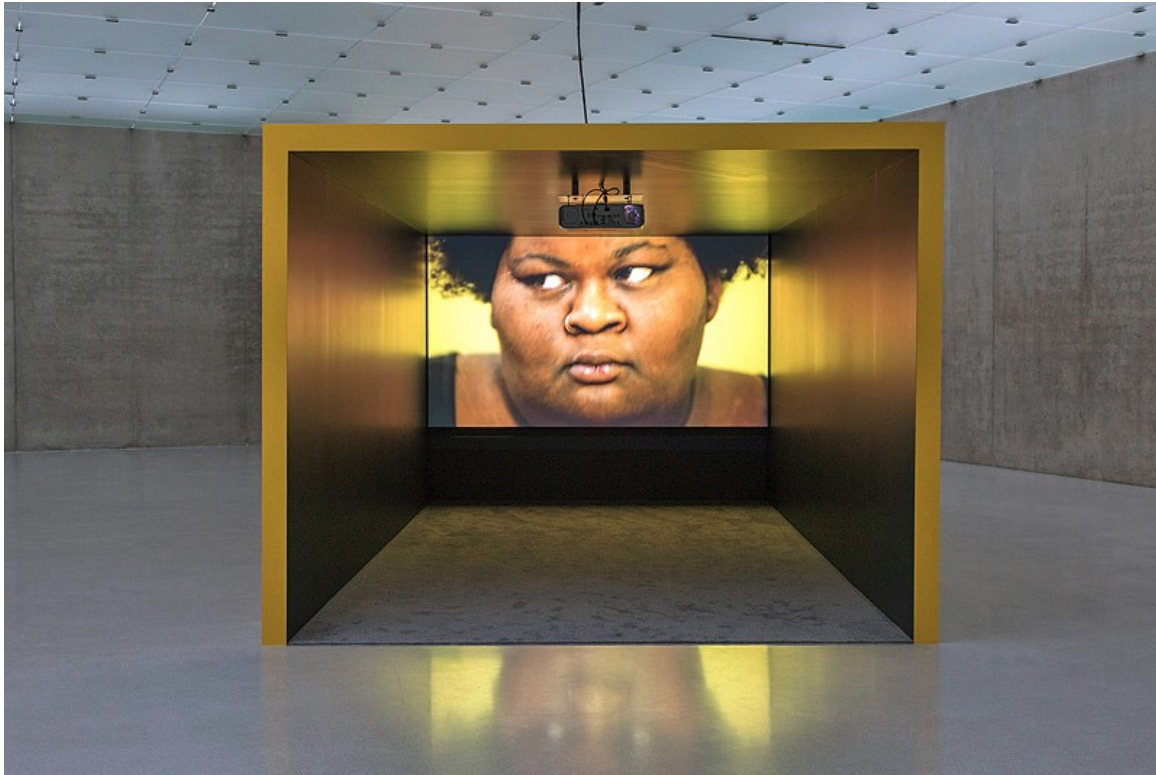
Mika Rottenberg, Kunsthaus Bregenz

Das Video „Bowls Balls Souls Holes“ zeigt einen Bingo-Salon, zu dessen geschäftiger Atmosphäre exzentrische Figuren wie eine extrem dicke Frau den melancholischen Kontrapunkt bilden