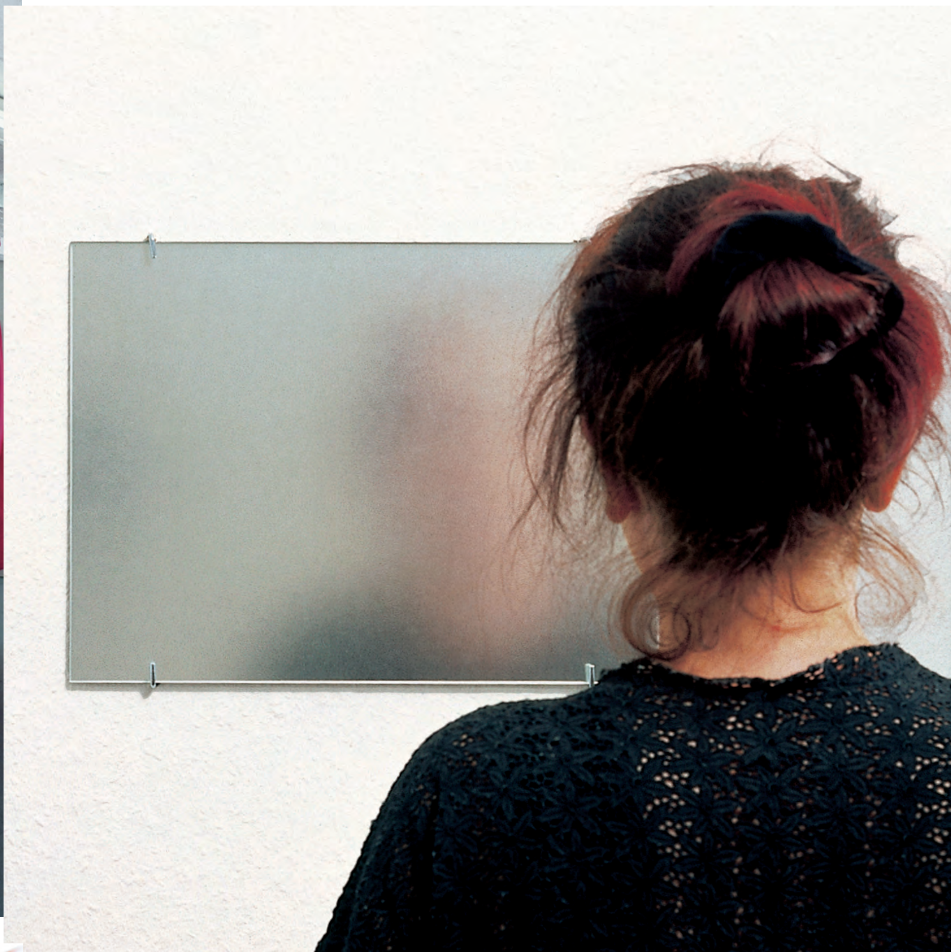
verschwinden , 1999, 3 Spiegel und sandgestrahlte Glasscheiben je 30 x 40 cm (Ausschnitt)