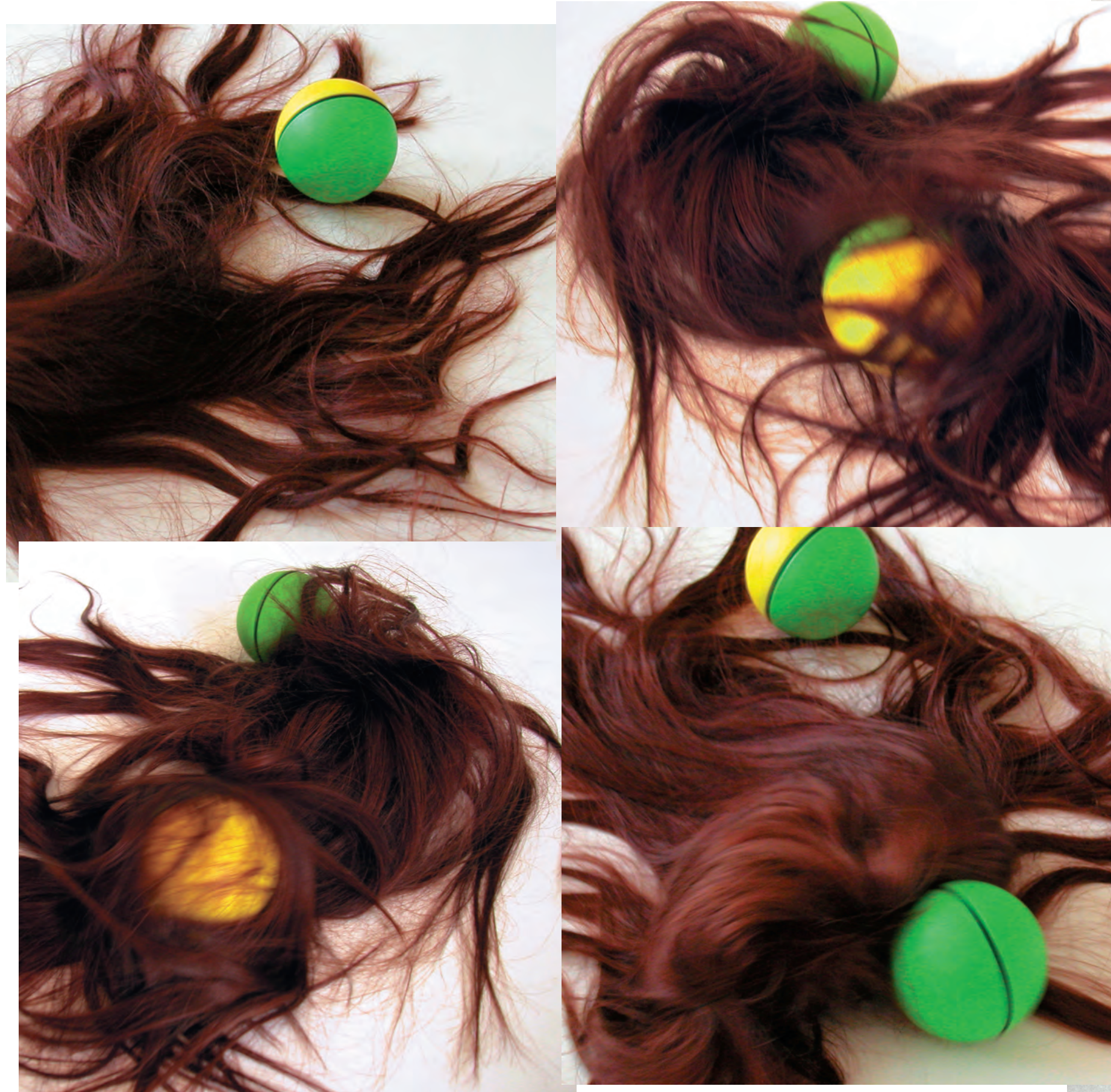
Haar der Berenike , 2009, Perücke der Künstlerin, Motorkugeln, 8 x 60 x 40 cm