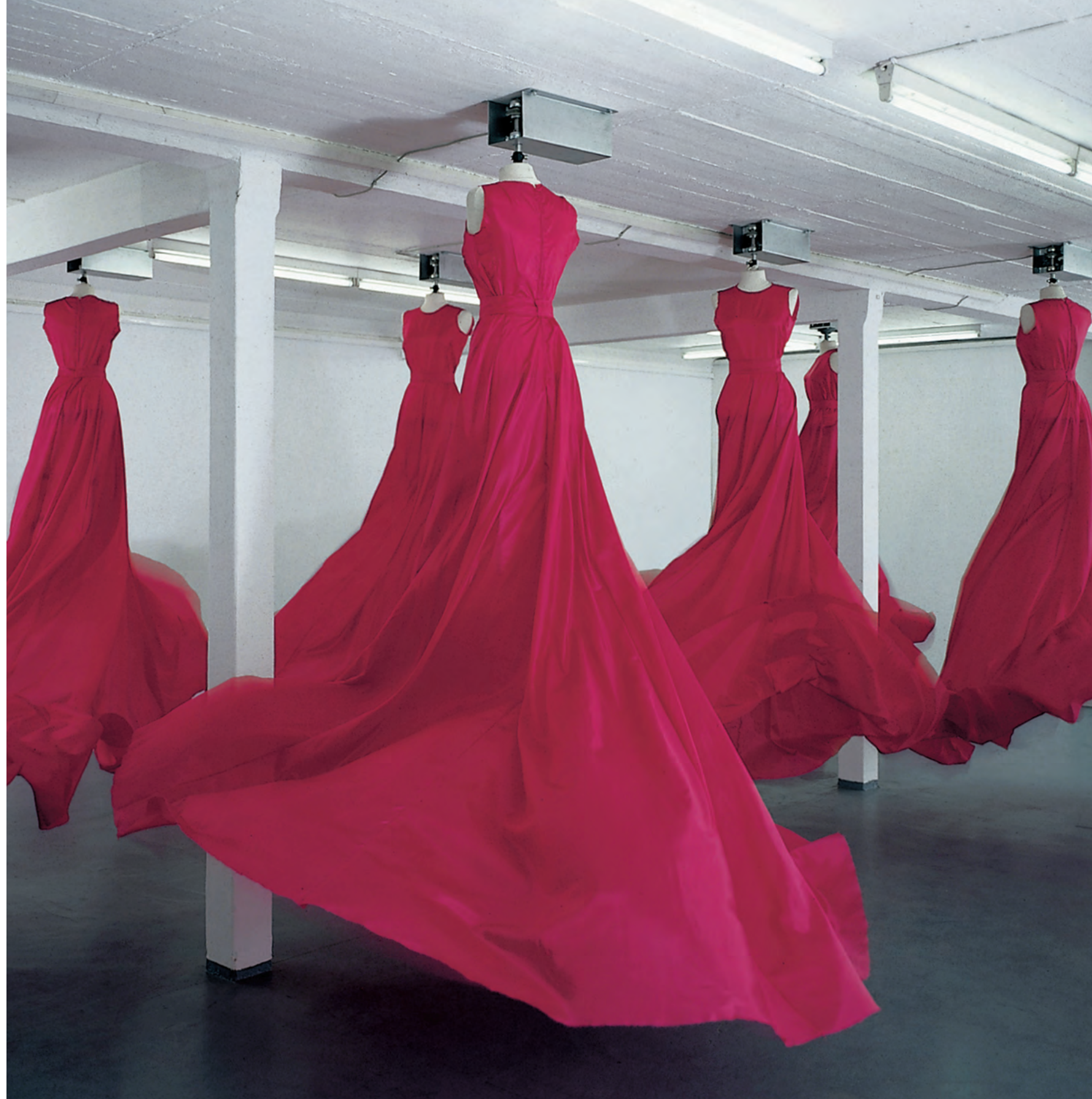
tour en l'air , 1997/98, 7 rote Taftkleider, Dekorationsbüsten, computergesteuerte Elektromotoren (Technik: Reinhard Kahl), 280 x 700 x 1100 cm