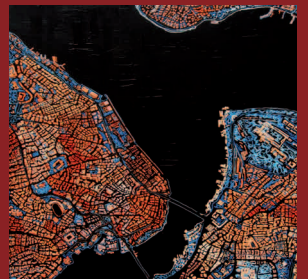
„Istanbul“, 120x150 cm, Acryl auf Leinwand, Ausschnitt