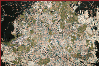
„Berlin“, 150x150 cm, Acryl auf Leinwand, Ausschnitt