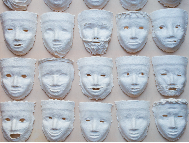
YOLY - weisse masken