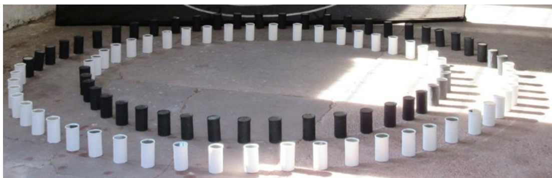
Detail aus "VIA DEI CERCHI" 2015, Pilastro, Italien