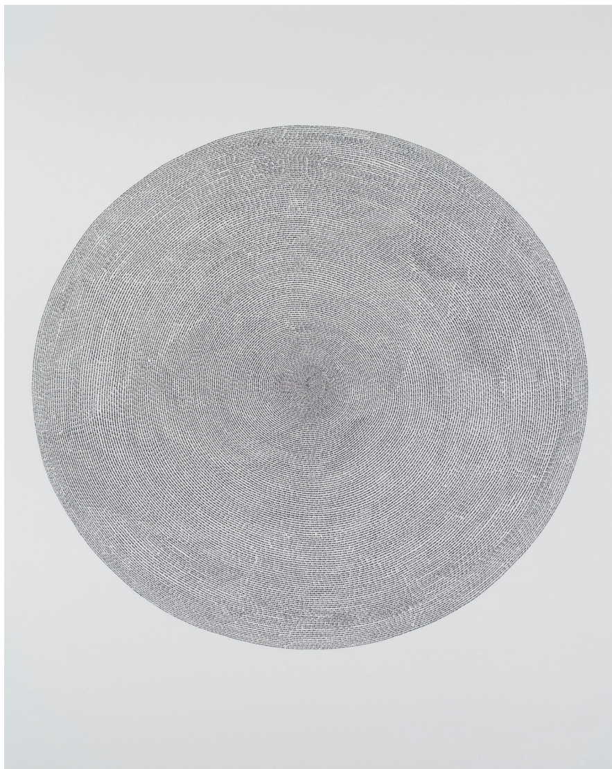
Laura Lamiel, 3 ans, 3 mois, 3 jours, 2012, encre de Chine sur papier, 100 x 80 cm.

seront tour à tour sondées et mises en valeur visuellement, qu'il s'agisse du jeu instrumental et vocal, de la notation, de l'écoute, ou encore de l'aura immatérielle d'une œuvre. Transmettre quelque chose de la musicalité d'une voix ou d'un instrument par le seul modelé de son apparence extérieure, au moyen d'un art silencieux par définition, demeure