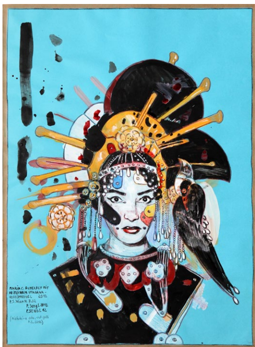
Peter Sengl, Maria C. Butterfly , 2012 Mischtechnik auf Papier, 62 x 46 cm