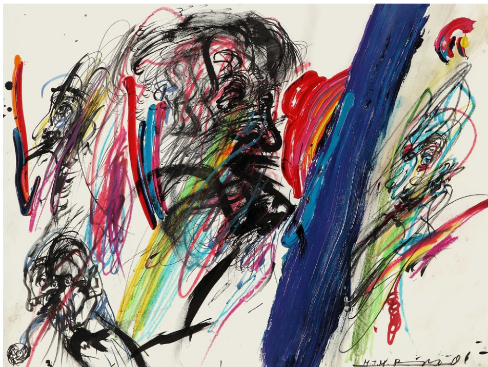
Franz Ringel, Fieberkopf , 2006 Mischtechnik auf Papier, 42 x 55 cm