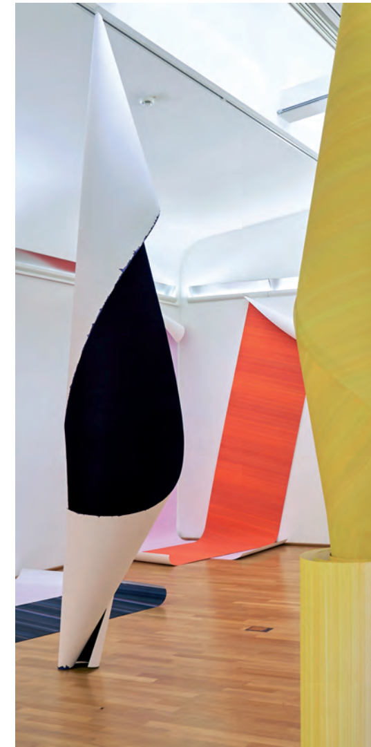
Elisabeth Sonneck Rollbild5 Rotation Orange Öl auf Papier, je 110x500cm, Kunstmuseum Ahlen (D), 2015, Foto: Hubert Kemper