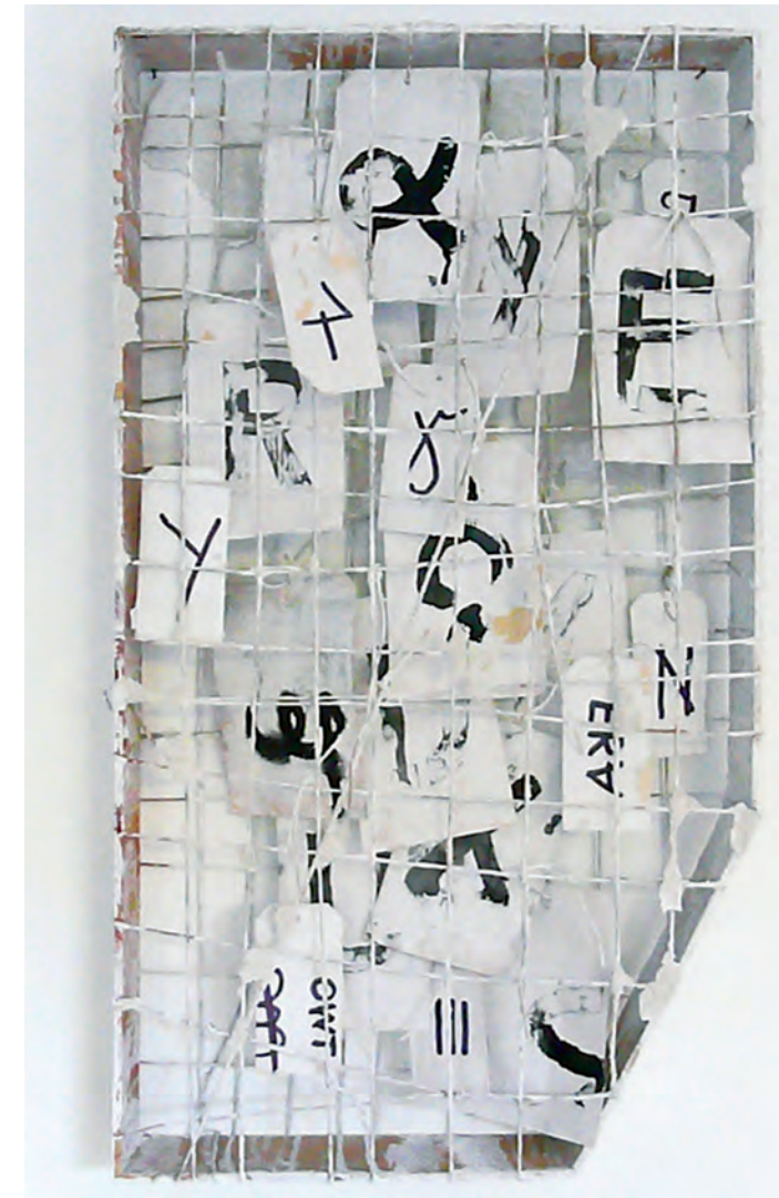
Walter Weer Verstummen 2016, Karton, Papier, Schnur, bemalt, 80 x 45 x 8 cm