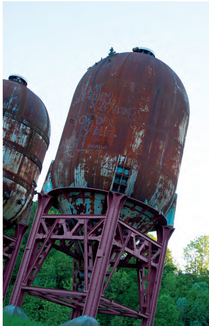
Papiermachermuseum Steyermühl, Zellstoffkocher