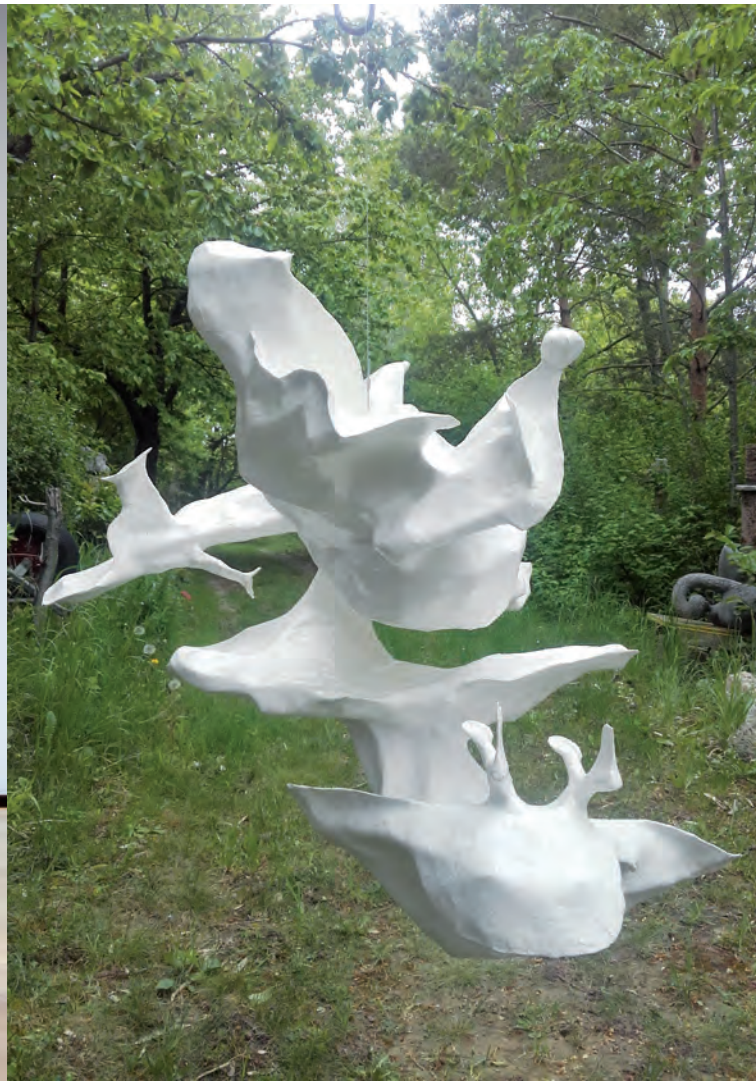
Peter Dörflinger o.T. 2014, Papier, Leim, 70 x 65 x 87 cm