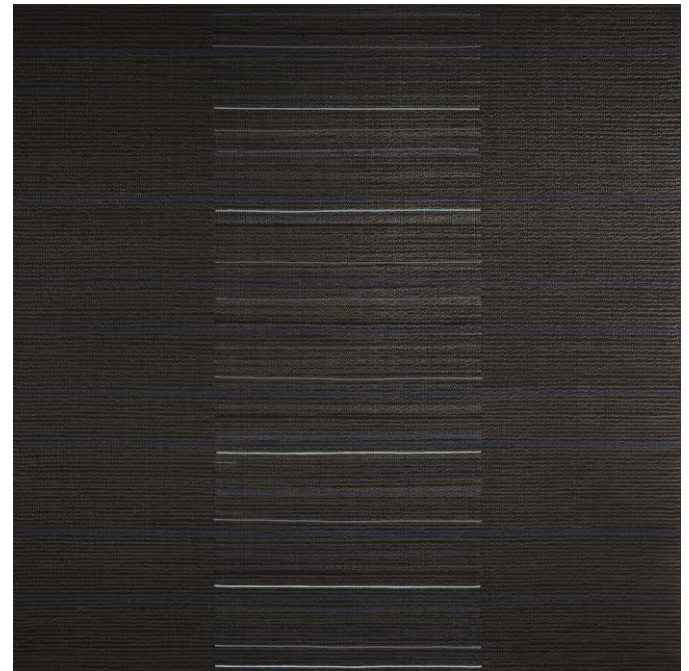
O.T., Graphite and acrylic on black paper, 70 x 70 cm, 2021